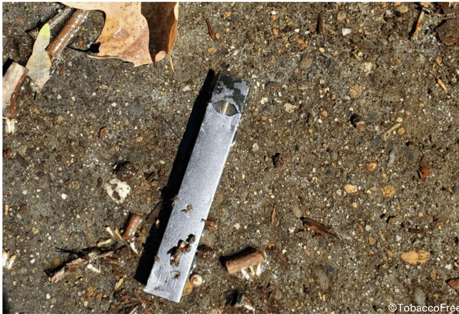
E-Zigaretten der vierten Generation, wie zum Beispiel Juuls, werden häufig nicht ordnungsgemäss