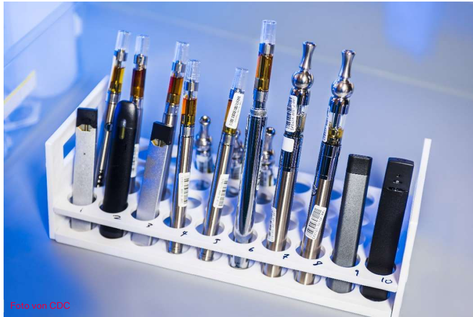
Ein Reagenzglasregal mit Beispielen von verschiedenen E-Zigaretten.