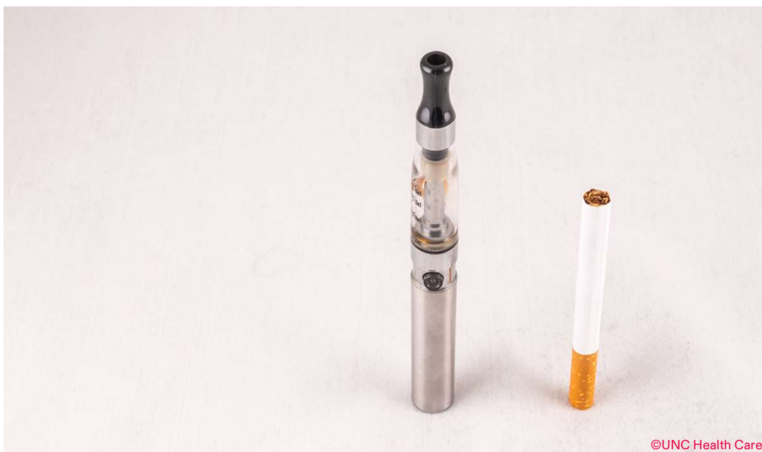
Eine E-Zigarette der zweiten Generation neben einer herkömmlichen Zigarette

dass E-Zigaretten im Vergleich zu Placebo-E-Zigaretten (E-Zigaretten ohne Nikotin) Raucherinnen und Rauchern helfen, mit dem Zigarettenkonsum aufzuhören, wiesen aber gleichzeitig darauf hin, dass diese Studien methodische Mängel aufweisen. In Bezug auf die Rolle von E-Zigaretten als Massnahme zur Entwöhnung vom herkömmlichen Tabakrauchen kam SCHEER zum Schluss, dass es angesichts der geringen Anzahl sowie der mangelnden Qualität der wissenschaftlichen Studien nur schwache Belege dafür gibt, dass E-Zigaretten bei der Raucherentwöhnung wirksam helfen. 15 Auch der jüngste Bericht (2020) des Surgeon General über die Raucherentwöhnung stellt fest, dass die empirische Evidenz nicht ausreicht, um zu folgern, dass E-Zigaretten die Raucherentwöhnung unterstützen. 20